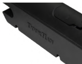
Высокопрочный алюминиевый сплав