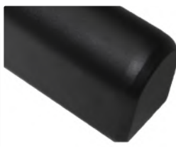
Защита от негативных воздействий окружающей среды