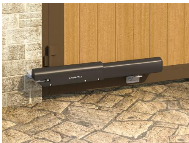
Распашные ворота всех типов