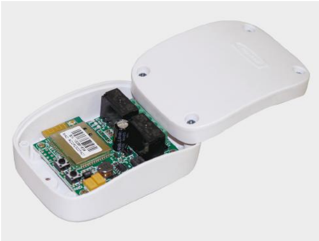
Wi-Fi-модуль для беспроводного управления (выработки сигнала управления, NO) электроприводами