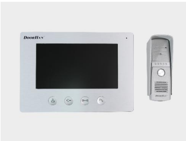
Домофон DOMO7 с функцией управления воротами и калитками