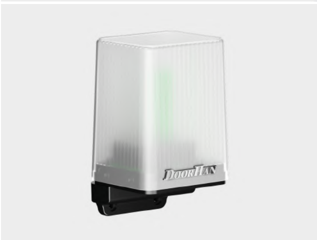
Сигнальная светодиодная лампа с антенной Lamp-PRO для оповещения движения ворот