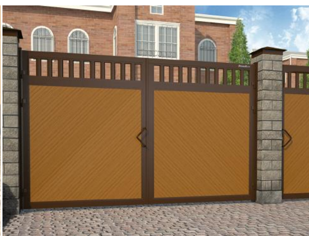
Распашные ворота и калитки